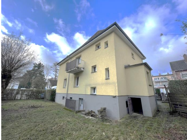
Hausansicht vom Garten