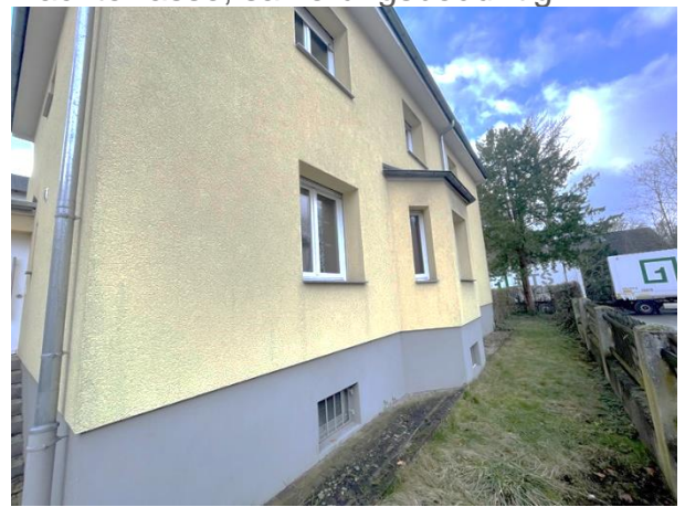
Hausansicht vom Garten