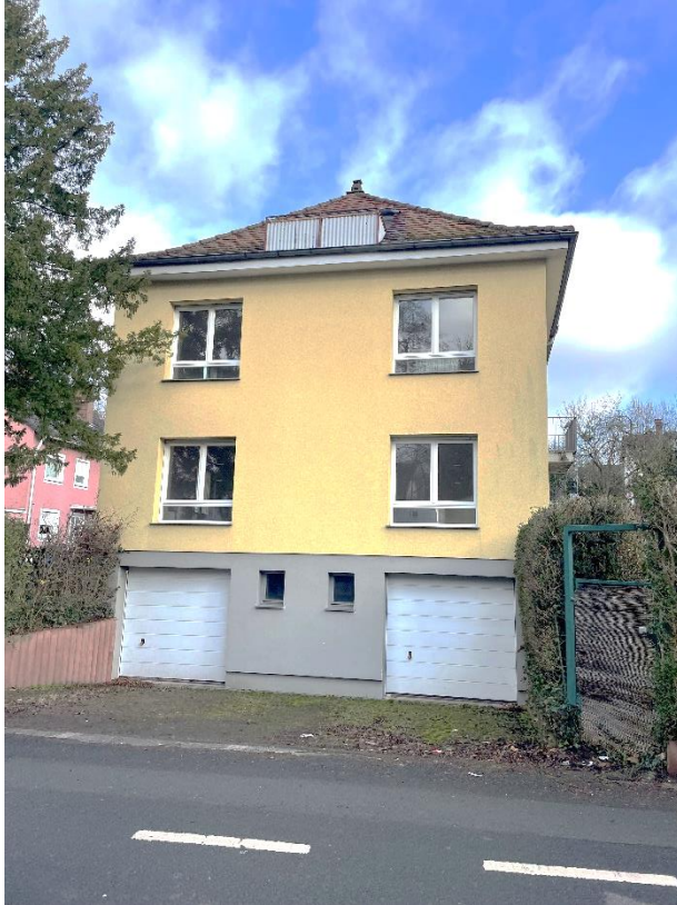
Seitliche Hausansicht, 2 Garagen