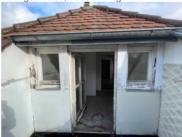
Zugang Terrasse DG