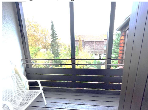
Überdachter Balkon, OG