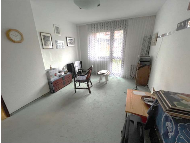
Eines von drei Schlafzimmern im OG