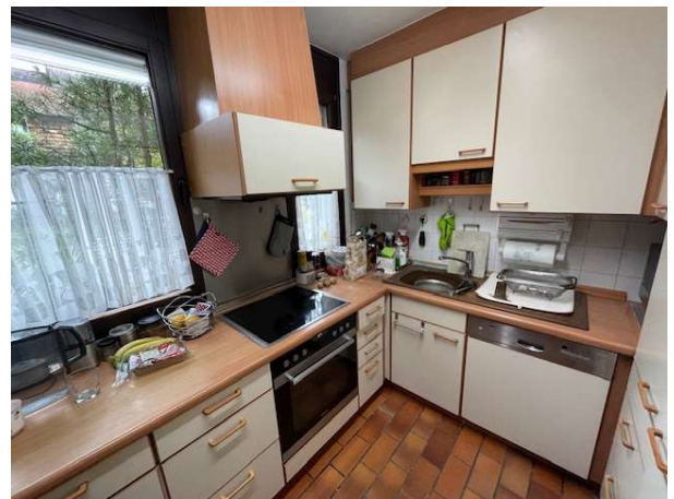
Geräumige Küche, eingebaut