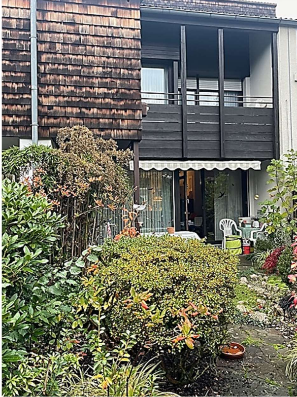
Hausansicht vom Garten