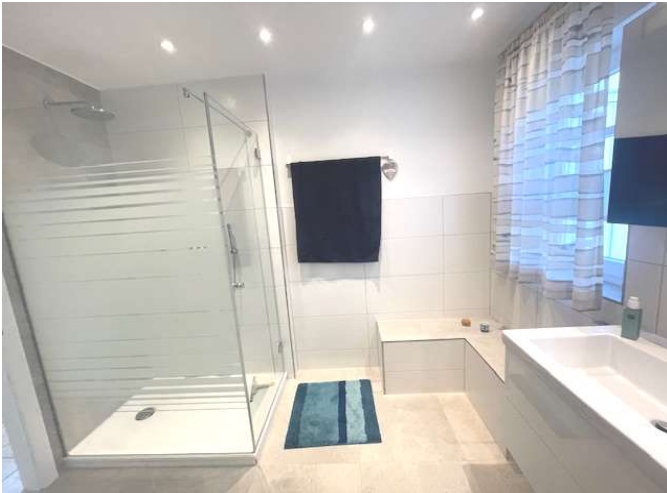
modernes Bad mit Wanne und Dusche