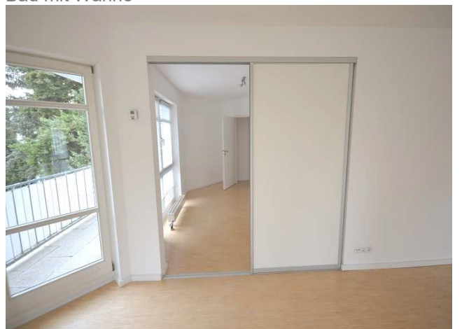
Zimmer mit Trennwand zum Wohnzimmer