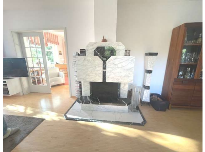
Wohnbereich mit offenem Kamin