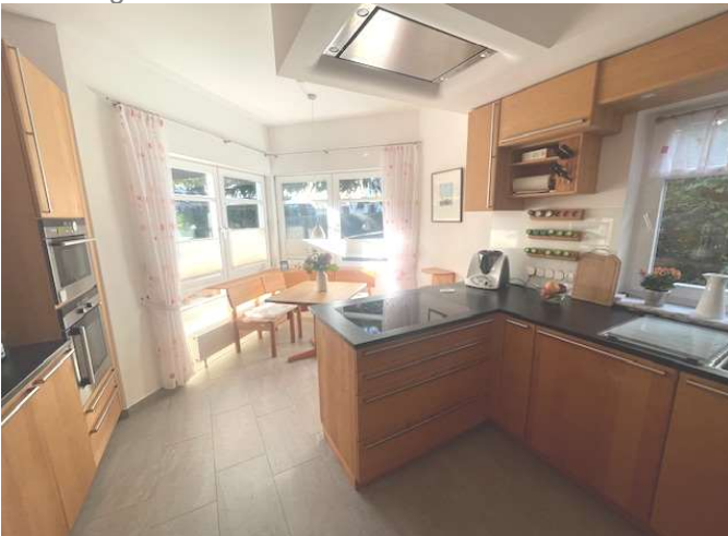
Wohnküche (Einbauten nicht im Kaufpreis enthalten)