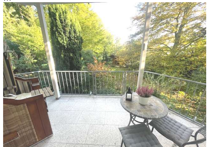
Balkon zum Garten