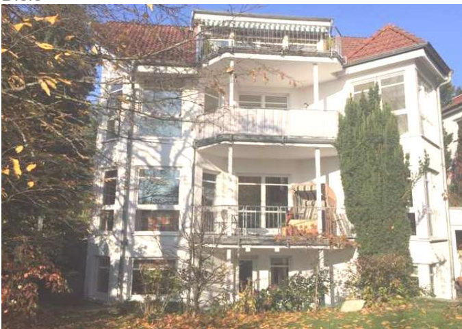
Hausansicht vom Garten