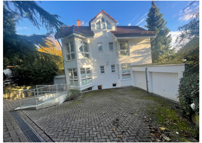
Hausansicht von der Straße