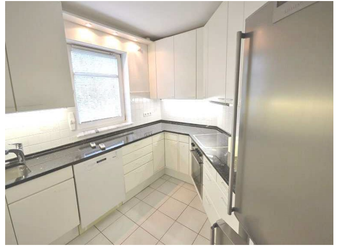
Eingebaute Küche ...