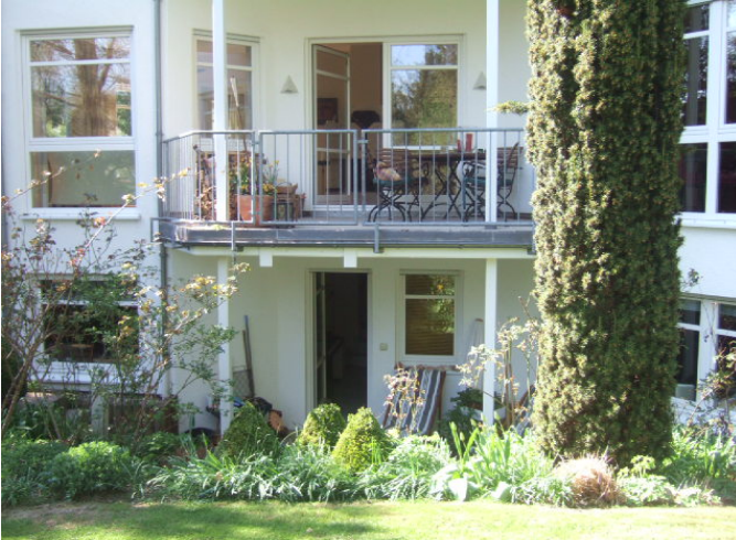
Wohnungsansicht vom Garten