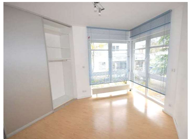
Schlafzimmer mit Einbauschränk